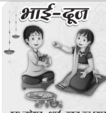
इस त्योहार, भाई-बहन का प्यार

केन्द्र सरकार, राज्य सरकार उत्तर प्रदेश, विद्युत विभाग से विज्ञापनों हेतु स्वीकृत